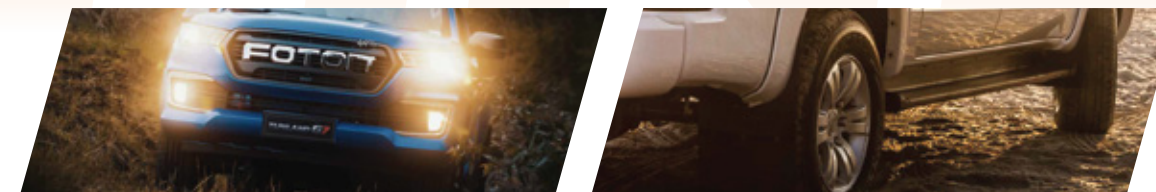
مصابيح ضباب كبيرة ومصابيح قيادة نهارية LED ثلاثية الاتجاهات جنط الومنيوم مقاس 18 انش