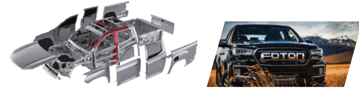
خمس نجوم NCAP تحذير من الاصطدام الأمامي، بوش Bosch 9.3 ESP