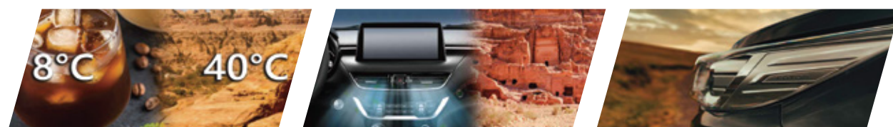
صندوق تخزين الراكب مع مكيف للهواء مكيف هواء ذكي، تصفية هواء اوتوماتيكية PM2.5 تأخير إطفاء المصابيح الأمامية بعد الإقفال