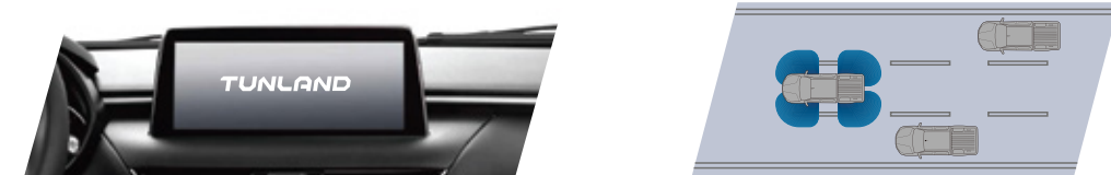
شاشة تحكم ذكية مقاس 10.25 انش كاميرا خلفية بانورامية عالية الدقة بزواوية 360° درجة لرؤية النقاط العمياء كاميرا احتياطية 360 درجة + تقنية كشف النقطة العمياء